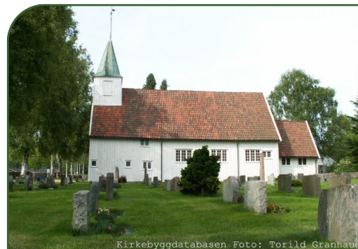
Kirkebyggdatabasen Foto: Torild Granhaug

Har du glemt noe, ber vi deg å hente det før fristen.