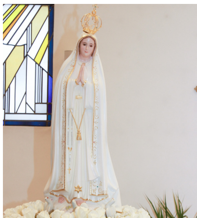
Mai-måned er viet til Jomfru Maria. Kirken oppfordrer spesielt å be rosenkransen i familien.

Programmet for turen er fortsatt under utarbeidelse. Menigheten vil komme med mer informasjon når planen for turen er utarbeidet.