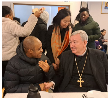
Alle som ville, kunne slå av en prat med biskopen i kirkekafeen og lunsjen.

besøk i menigheten vår. Torsdagen før vasket og ryddet alle nasjonale grupper i kirken og kiga som aldri før. Det skulle være fint når hyrden kommer. Biskopen hadde et tett program, med samtaler og møter for å bli kjent med alt som foregår hos oss. Avslutningen var lunsj med snitter og kaker sammen med alle kateketer og medhjelpere i menigheten. Til slutt sang alle "Må Gud velsigne deg" for biskopen.