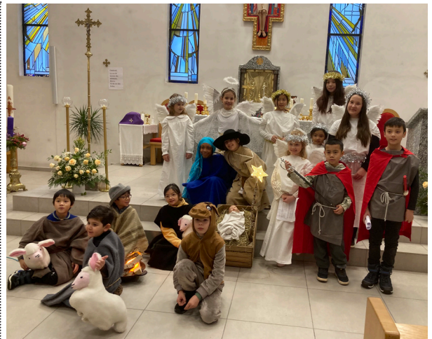
Bilder fra katekesemessen