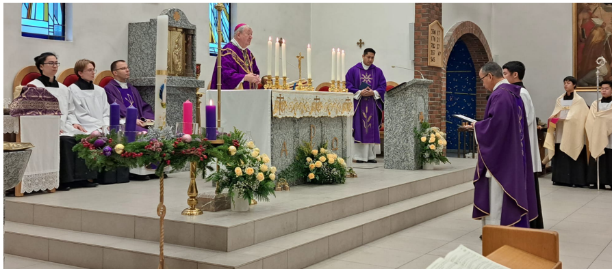
Biskop Bernt holdt messe 3. desember.